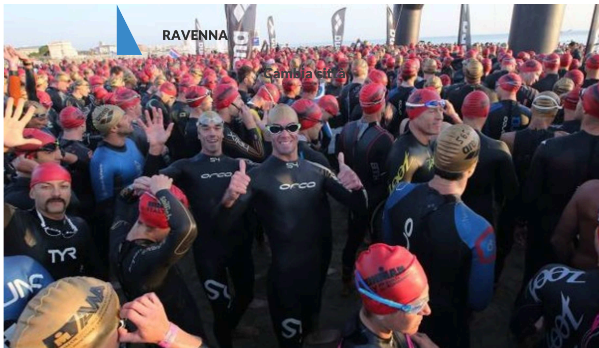
Ironman a Cervia, la carica degli atleti d'acciaio