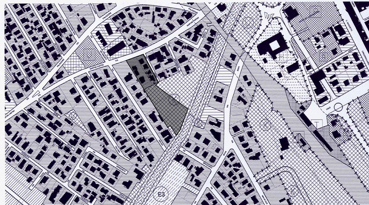
STRALCIO P.R.G. COMUNE DI CERVIA - TAVOLA "A 07"