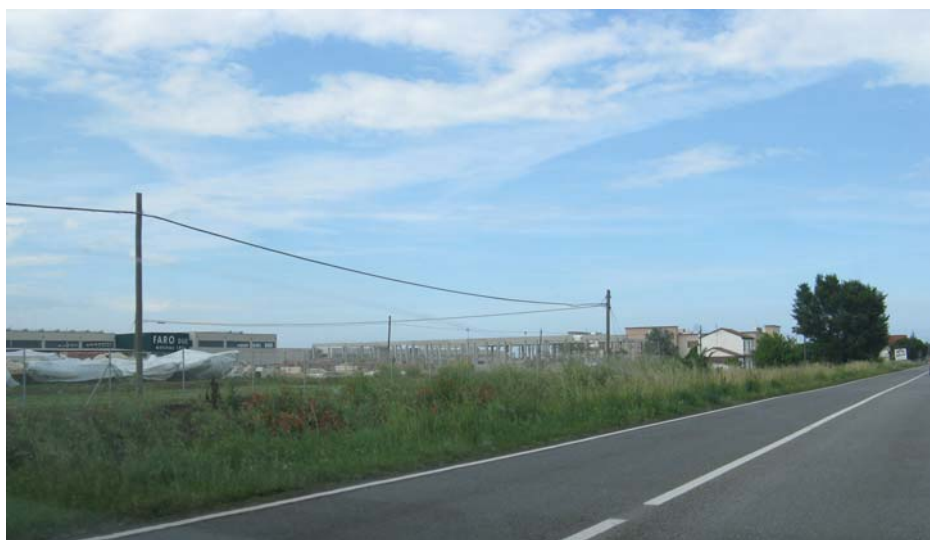
Foto 4 vista dalla SS 71 bis