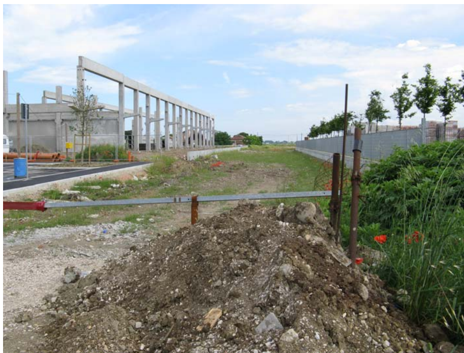
Foto 1 ingresso all'area