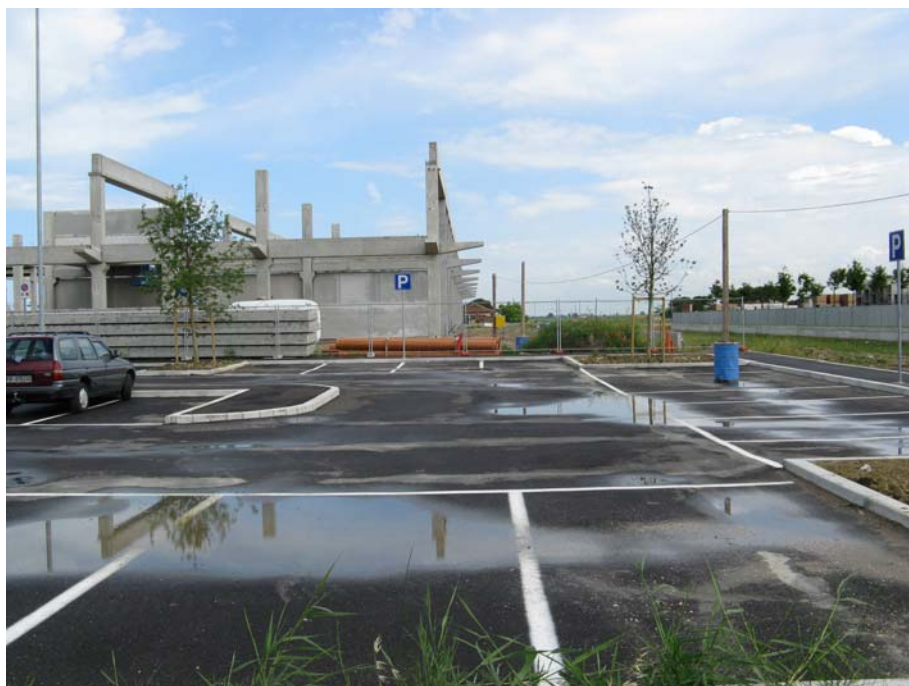
Foto 2 parcheggio esistente a fianco dell'ingresso