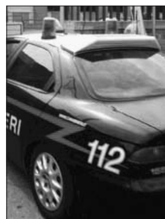
Sono intervenuti i carabinieri