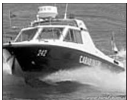
La motovedetta che ha tratto in salvo i velisti

CERVIA. Attimi di panico sabato pomeriggio al largo della costa. Si è reso infatti necessario l'intervento della motovedetta dei carabinieri della stazione di Milano Marittima per salvare due ragazzi che si